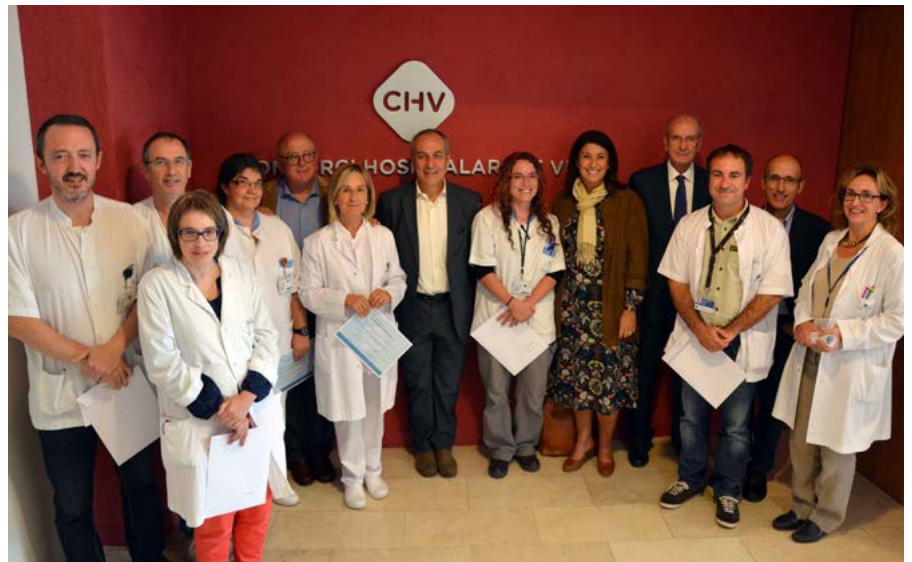
Inauguració del curs acadèmic 2015-2016 i reconeixement als millors projectes del CHV

Com a novetat d'enguany, al final de l'acte també es va homenatjar els quatre professionals del CHV que van obtenir el grau de Doctor durant aquest darrer curs: dos metges, una infermera i un psicòleg.