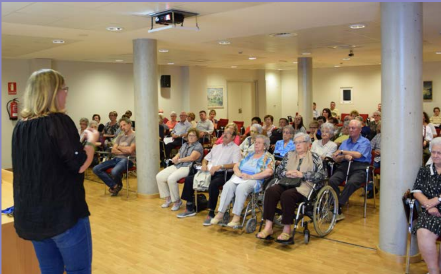
Taula rodona pel Dia Mundial de l'Alzheimer

Amb motiu del Dia Mundial de l'Alzheimer, l'Hospital Sant Jaume de Manlleu va acollir una taula rodona oberta al públic en la que es van donar pautes i consells útils per tenir cura de les persones que pateixen algun tipus de demència.