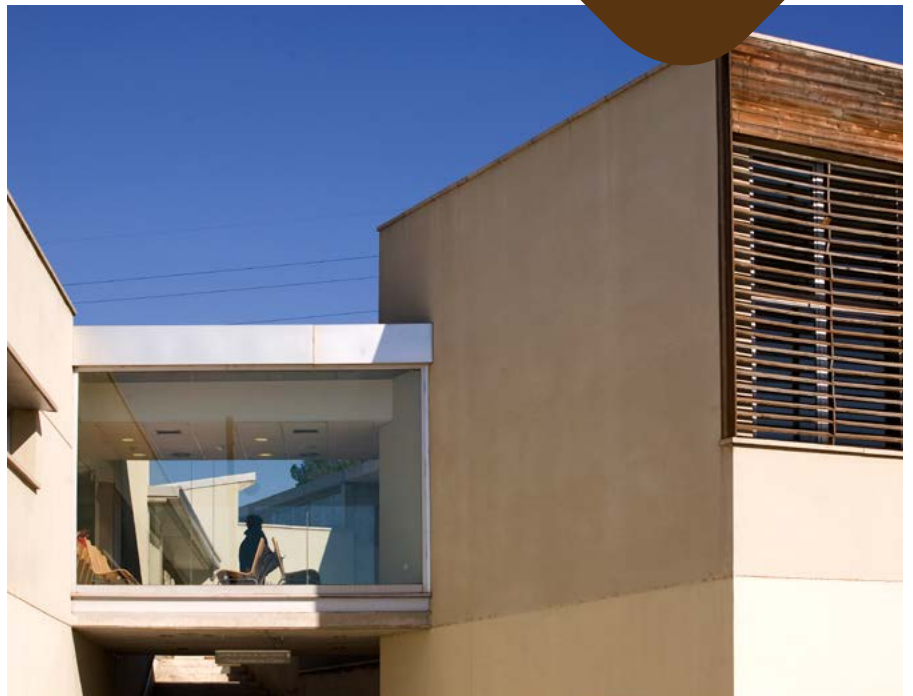
Façana d'Osona Salut Mental

L'objectiu del nou Pla de Salut de Catalunya és reduir un 10% la mortalitat per suïcidi d'aquí a l'any 2020. Amb aquesta finalitat, el Departament de Salut va començar a implantar l'any 2014 el Codi Risc de Suïcidi (CRS), un protocol d'actuació destinat a disminuir les temptatives de suïcidi i la repetició mitjançant la gestió protocolitzada i homogènia de les persones amb risc de suïcidi i la seva identificació pels centres de la xarxa pública del sistema sanitari. En un any, el Codi Risc de Suïcidi ja s'ha desplegat al 54%